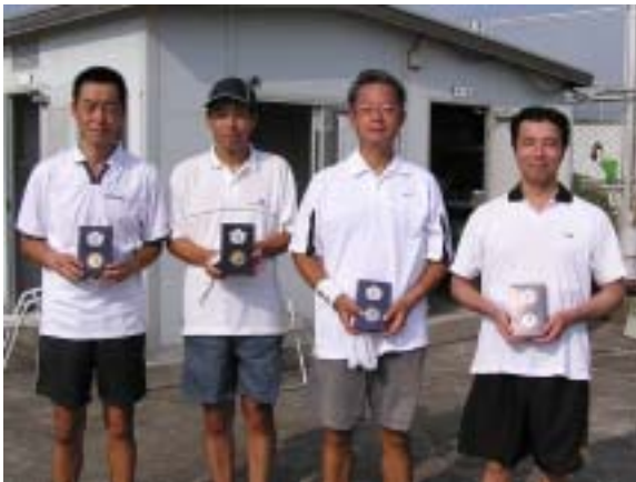
優勝 : 細田・橋 (F C T) 準優勝 : 宮崎・明松 (E S S C)